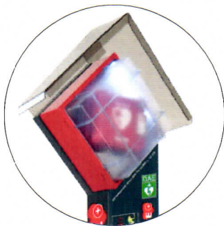
Cappottina protettiva in plexiglass